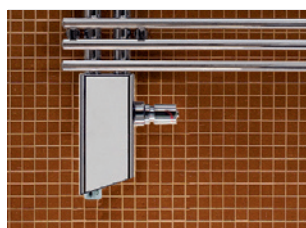
Aansluitblok kap lang voor gemengd gebruik (cv en elektrisch)