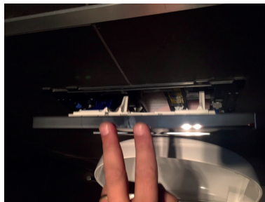
Sluit de Toiletblokhouders.