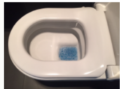
Als u na 5 minuten het toilet doorspoelt krijgt u een hygiënische blauwe of groene spoeling.

Het blokje heeft ongeveer 5 minuten nodig om volledig in te werken. StarBlueDisc zorgt voor de reiniging van het toilet en doodt ook bacteriën. Als er in het spoelwater geen kleur meer zichtbaar is, is het theoretisch tijd om er een nieuw blokje in te doen. Plaats echter pas een nieuw blokje als er ook de eerst volgende ochtend, na een spoeling, geen kleur meer zichtbaar is. Zo bent u er zeker van dat het toiletblokje compleet is opgelost.