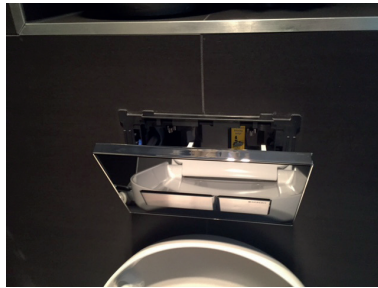
Open de Toiletblokhouders.