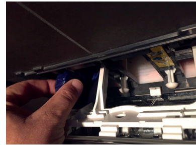
Zet het StarBlueDisc blokje rechtop in de Toiletblokhouders