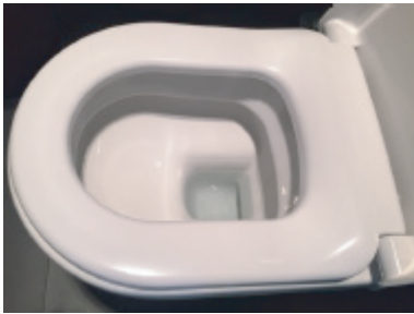
Toilet zonder StarBlueDisc toiletblokje.