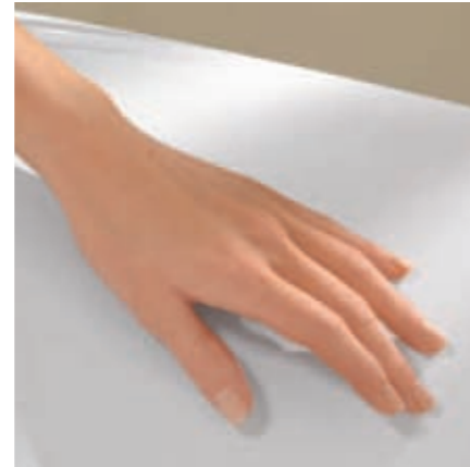
Glad, poriënvrij oppervlak

Daarnaast zijn Quaryl®-producten slipvast. Dat geeft een goed en veilig gevoel.