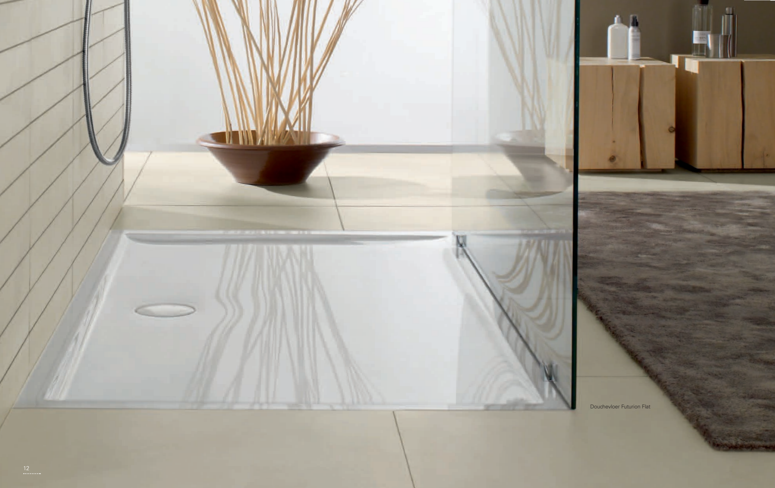
Douchevloer Futurion Flat