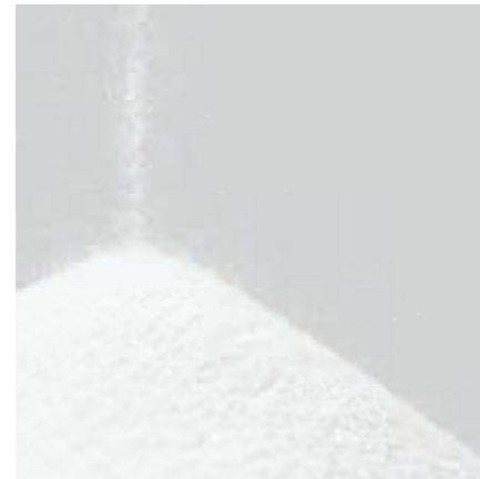
De basis: 60% puur, fijngemalen kwartsmeel