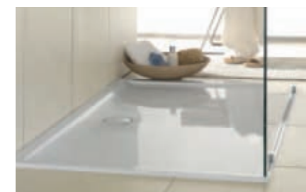
Douchevloer Futurion Flat