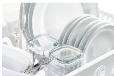
Schoon (vaat-)was resultaat